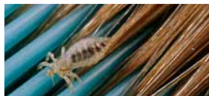
Hoofdluis op een kam.